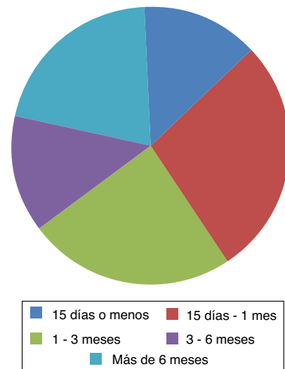
Figura 3 Tiempo de evolución del dolor de tobillo en los participantes.

La frecuencia de PGM activos encontrados en los sujetos evaluados fue del 4,11% (7/170). La frecuencia de aparición